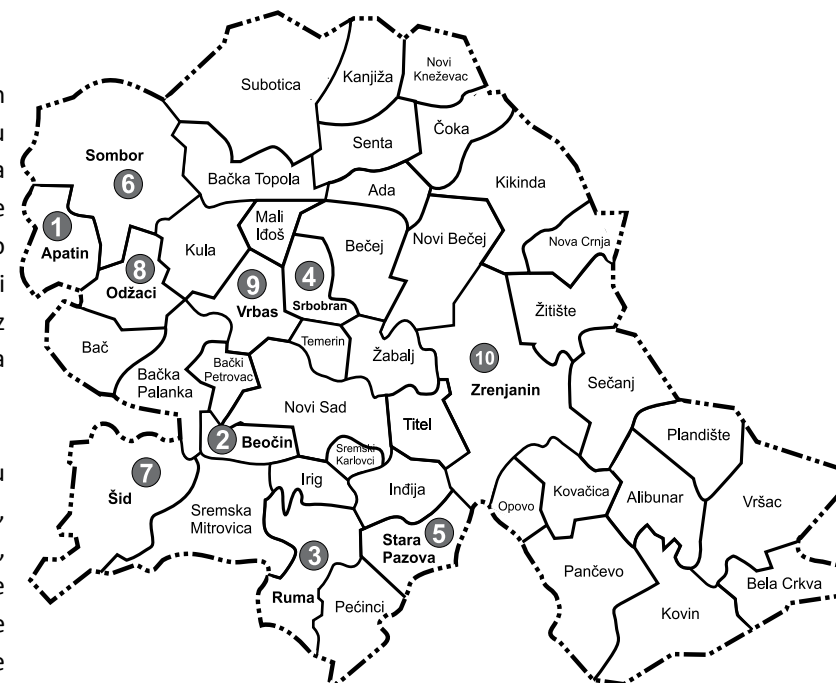
Mapa opština u kojima je realizovan projekat

Tokom treninga, učesnici su imali zadatak da definišu temu kampanje, ciljeve i zadatke javnog zagovaranja, plan podrške, da urade analizu ključnih stakeholdera , da razviju poruku za nastup i stvore kanale komunikacije. Kao rezultat, učesnici su izradili lokalne planove akcije, u kojima su navedene aktivnosti koje će se realizovati, potrebni resursi, odgovorne osobe i vremenski rok za realizaciju.